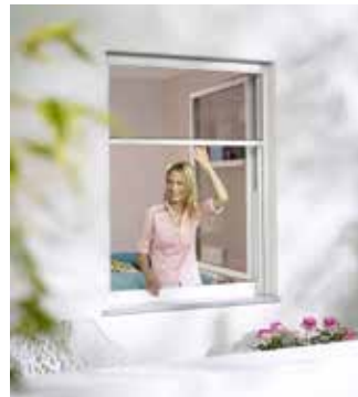
Rollos für Fenster und Türen