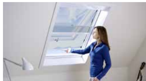
Rollo für Dachflächenfenster - Innenmontage

Die Abrollkante und die Höhenverstellung der Welle bewirken ein stets straffes und parallel geführtes Gewebe. Seitliche Bürstenführungen verhindern ein Ausfädeln des Gewebes bei Wind. Die individuelle Einstellung der Federkraft ermöglicht es, dass die Zugschiene an jeder gewünschten Stelle selbsthemmend stehen bleibt.