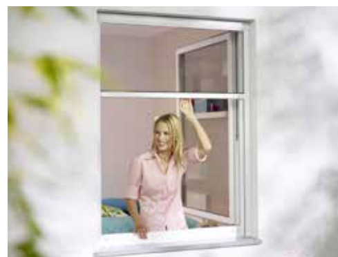
Rollo für Fenster - Außenmontage

wirksamer Insektenschutz • Variantenvielfalt • schützt vor Fluginsekten und sorgt für ungestörten Schlaf • 9 Standardfarben ohne Aufpreis • Bürstenabdichtungen • Fiberglasgewebe für ungehinderten Durchblick und höchstmögliche Luftzirkulation • erhöhte Lebensdauer durch stabile ALU-Profile • elegante Optik • wirtschaftliche Lösungen